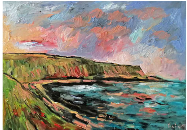
Detlev Foth Küste, Licht und Gischt | 2018 Öl auf Leinwand | 100 x 140 cm